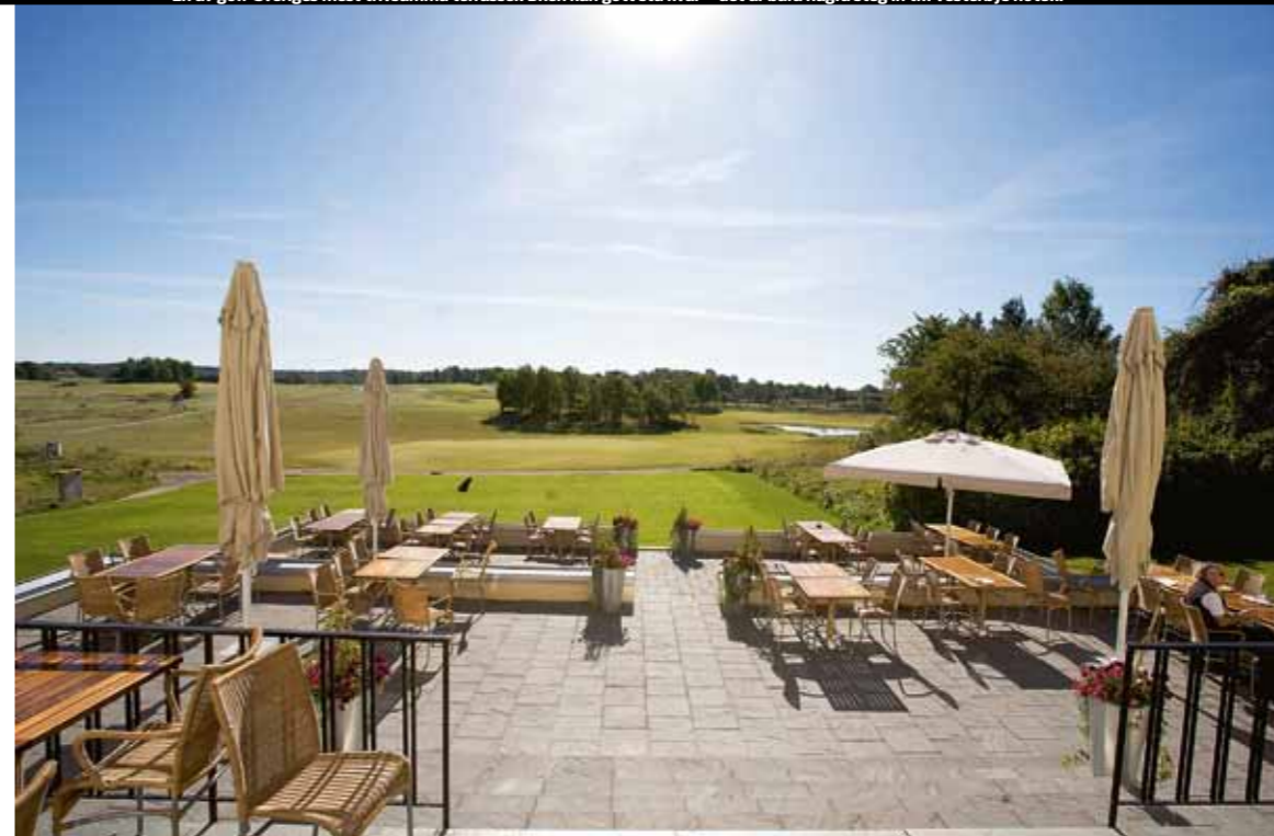
En av golf-Sveriges mest trivsamma terrasser. Bilen kan gott stå kvar – det är bara några steg in till Vesterbys hotell.

Ett par 5-hål som kan nås på två av den långt-slående som lyckas navigera de många hinder som finns längs vägen. Ge dock inte en eventuell eagleputt för mycket fart, det kan bli långt tillbaka upp på green.