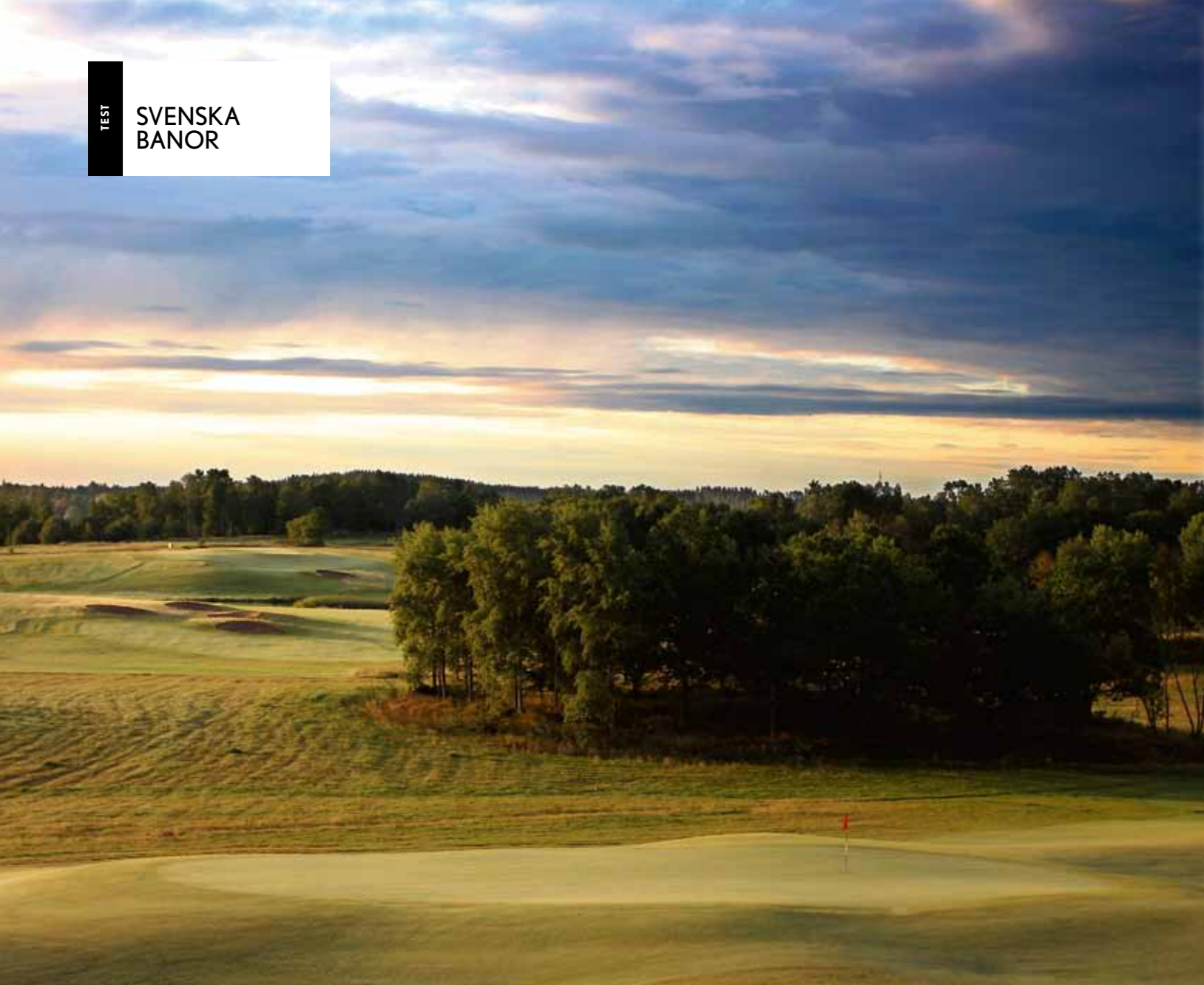
De upphöjda greenerna är Vesterbys signum. Om det är svårt att få stopp på bollen med en lobbwedge – hitta känslan med puttern!